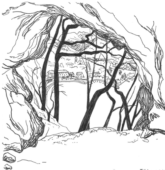
La grotte aux oiseaux, Talloires, 25.07.24

port pour remonter sur le roc de Chère, découvrant avec facilité l'emplacement de la grotte, que j'avais dépassée sans la voir lors de ma précédente visite. Je peux faire l'expérience, en me plaçant accroupie à l'intérieur, de cette vue d'oiseau sur la baie, cadrée par la roche saillante, et en saisir l'esprit en un croquis rapide. Les arbres sont encore nus, dans leur état hivernal, zébrant la perspective sans la cacher. Il était temps, car dès lors qu'ils verdissent, la grotte ne laissera voir que l'opulence des feuillages printaniers, et la percée visuelle sur les lointains se refermera jusqu'à l'automne prochain.