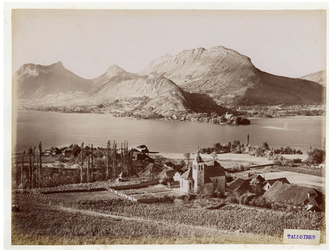
Photo ancienne de Talloires

Ici, j'imagine des approches originales qui me donneraient à voir ce territoire par d'autres angles. Je me vois observer le paysage par les lucarnes du sauna de l'abbaye de Talloires, situé dans ses anciens greniers vieux de mille ans. Ou encore participer à la GlaGla Race, une course de paddle organisée ici chaque mois de janvier, pour voir la plage depuis le lac en profitant de l'absence de feuilles qui ouvre des vues et crée des transparences. Ou encore : faire un vol de parapente au-dessus de la baie, depuis les aires de décollage situées juste au-dessus. Enfin, je rêve de retrouver les descendants du peintre Albert Besnard 2 pour entendre de vive voix leur récit du coup de foudre de leur aïeul pour la beauté des lieux, où il s'installa et fit construire une Villa au bord de l'eau.