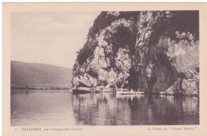
Photo ancienne du Roc de Chère

Le bout du passage étroit est en impasse, je me retrouve dans une presque-plage, ou plutôt dans un repli de taillis qui glisse vers l'eau et y enfonce ses racines. Devant sa surface verte et turquoise se trouve un rouge-gorge, dont la touche de couleur chaude sur le poitrail forme avec les teintes du lac un contraste frappant. Je m'approche au plus près de lui, suffisamment près pour sentir le tremblement par lequel il lutte contre le froid, et les ébrouements soudains qui l'agitent et gonflent son plumage. Cette crique boisée et emmêlée de branchages est mon second point d'accroche à l'extérieur du site. Repensant au minuscule port de Quoex où je me trouvais plus tôt, j'ai là deux points pour fixer le filet que je lance à travers la baie, celui qui m'aidera à identifier ses richesses.