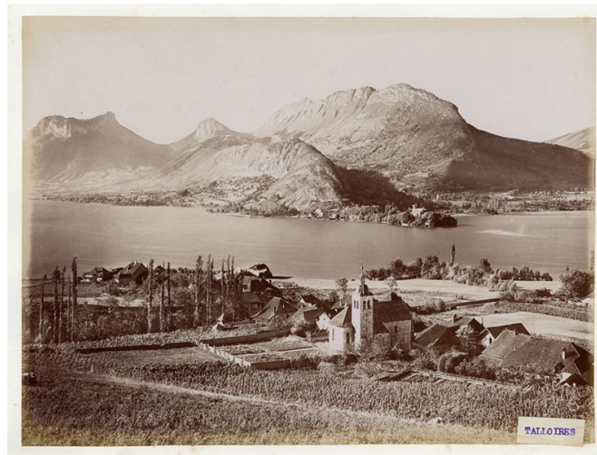
Photo ancienne de Talloires

Ici, j'imagine des approches originales qui me donneraient à voir ce territoire par d'autres angles. Je me vois observer le paysage par les lucarnes du sauna de l'abbaye de Talloires, situé dans ses anciens greniers vieux de mille ans. Ou encore participer à la GlaGla Race, une course de paddle organisée ici chaque mois de janvier, pour voir la plage depuis le lac en profitant de l'absence de feuilles qui ouvre des vues et crée des transparences. Ou encore : faire un vol de parapente au-dessus de la baie, depuis les aires de décollage situées juste au-dessus. Enfin, je rêve de retrouver les descendants du peintre Albert Besnard 2 pour entendre de vive voix leur récit du coup de foudre de leur aïeul pour la beauté des lieux, où il s'installa et fit construire une Villa au bord de l'eau.