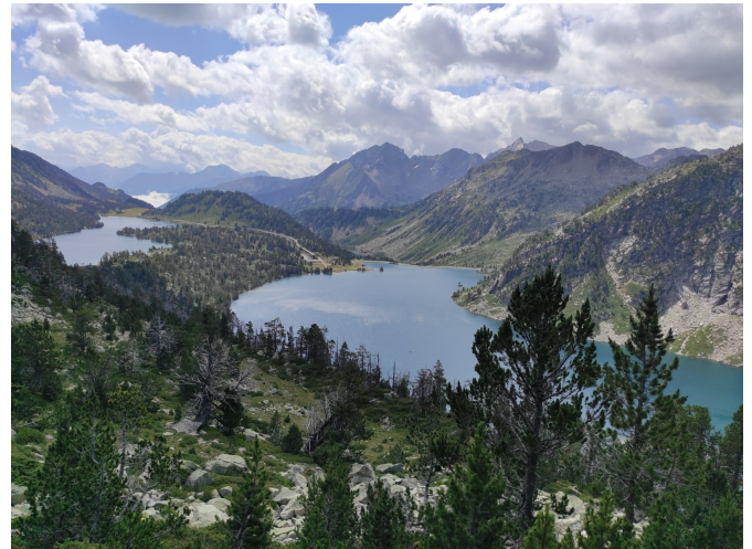
28 juillet 2021 – la rencontre au coeur de la réserve naturelle du Néouvielle

Finalement, comme le dit Sylvain Tesson : « marcher conduit à l'essentiel » et dans cette traversée, l'essentiel se joue pour une partie dans ces gens que nous rencontrons.