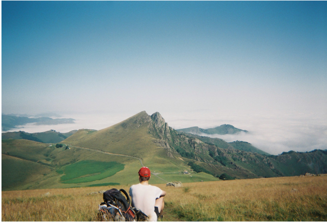
Passer des moments avec des inconnus, puis finalement des amis

De ce côté des Pyrénées, chaque instant est propice à la contemplation d'un lac, celui de Gentau par exemple, d'une cascade, celle de Lutour pour n'en citer qu'une, d'un pic, celui d'Ossau Iraty particulièrement, d'un col, celui d'Ayous pour son point de vue ou encore d'une gorge aride comme sur le fameux chemin de la Mâtüre. La contemplation est de chaque instant. Quand celle-ci est assouvie, ce sont les sonorités qui guident mes pas avec le bêlement des moutons, le ruissellement des cascades et torrents ou encore le brouhaha des grands sites de France où la nature perd de sa force. Chaque minute sur le sentier n'est que pur plaisir. Je me sens bien et apprécie de plus en plus le choix d'être parti à la rencontre de ce territoire.