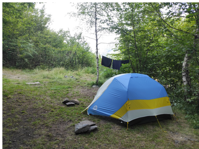
S'arrêter le temps d'une soirée