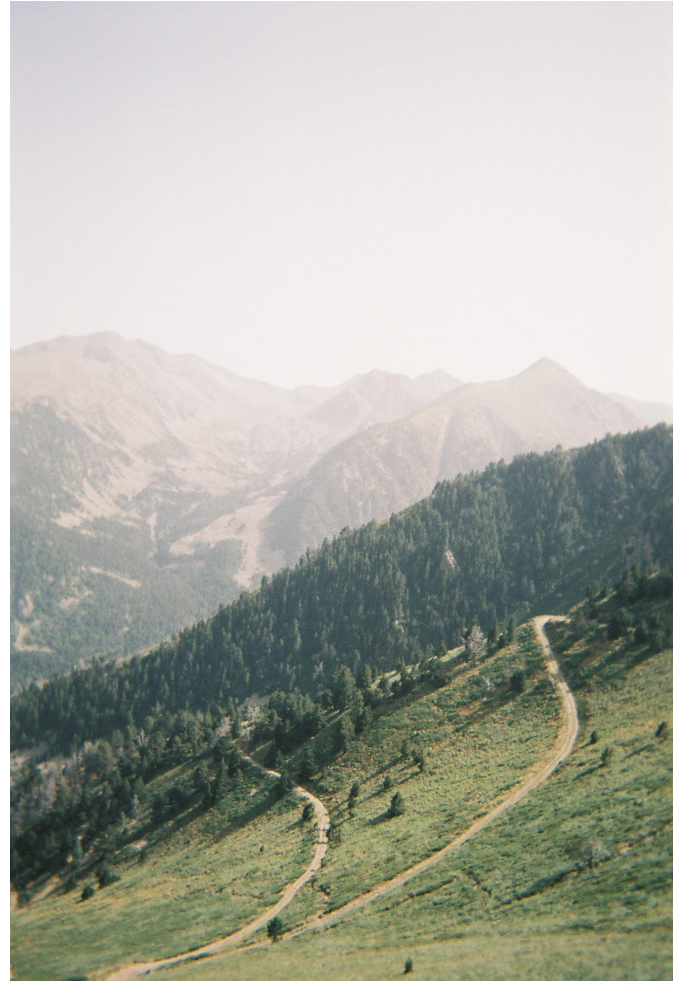
Le chemin est parfois tout trace

L'océan dans mon dos, je m'en éloigne à chaque pas un peu plus. Guidé par les marques blanches et rouges, je les suis inlassablement. Ces marques peignent mes journées, dessinent ma traversée et colorent mes rencontres. Cette traversée, je le sens déjà, va être différente de celles que j'ai pu réaliser auparavant... Quitter l'océan pour le massif pyrénéen s'est fait de manière progressive. Sur cette partie du GR, les montagnes sont encore basses, elles sont marquées par de forts reliefs où l'eau a creusé de profondes gorges (Kakuetta ou Olhadubi en sont de beaux exemples) ; par une végétation luxuriante mêlant de denses fougères vertes à la légèreté d'immenses hêtraies et par ces villages basques typiques aux bâtisses blanches et aux colombages rouge ou vert sapin. La veille du huitième jour, les couleurs luxuriantes du Pays basque ont troqué leurs teintes avec les couleurs plus brutales, plus arides des roches gris-brunâtre du Béarn.