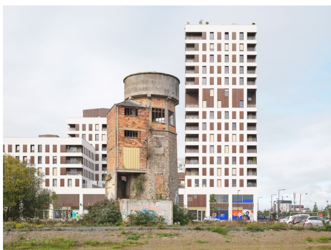
Images issues de la sélection croisée « grande ville » et « vestige »