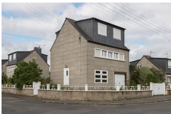
Images issues de la sélection croisée « ardoise » et « préfabriqué »

La route, depuis le départ, est le continuum de leur mission et la voiture leur vaisseau d'exploration. C'est depuis elle qu'ils regardent le paysage, la France entière de manière continue et égale, mettant ainsi les grandes villes, les villages et les campagnes côte à côte, sans autres commentaires que ceux, parfois, qui apparaissent sur un panneau, sur un mur, ou dans l'incongruité de l'image. Il leur est pourtant arrivé (rarement) de quitter la route, quand « déroutés », un territoire semble se dérober. Alors la route ne suffit pas.