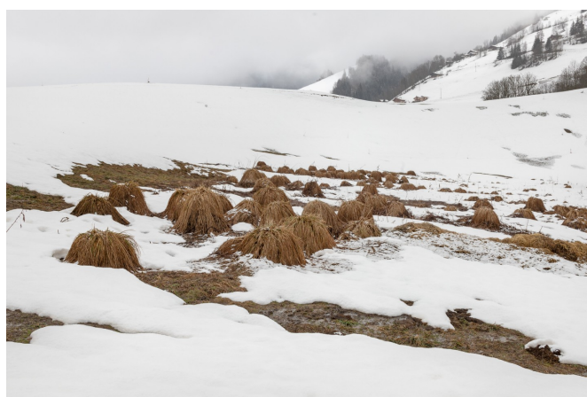
Images issues de la sélection croisée « moyenne montagne » et « curiosité naturelle »

À parcourir toutes ces images, à croiser les entrées thématiques pour faire apparaître sur nos écrans des collections issues du hasard (de nos clics et de nos envies), s'exerce une forme de fascination. Il y a le plaisir de retrouver ce que l'on a vu, comme cette incroyable villa Keller dont les excroissances sont perchées au-dessus de la Romanche, ou comme ce petit corpus d'image de la petite ville de son enfance : un bord de Loire, un grand pont, une glycine devenue arbores-