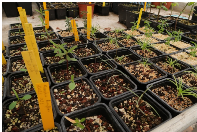
Semis en cours

Le processus d'introduction se fait dans le respect de la réglementation : convention sur la biodiversité, convention de Washington, protection des espèces patrimoniales, etc. Chaque plante est tracée, de son arrivée au jardin à l'éventuelle diffusion de sa descendance ou de matériel végétal.