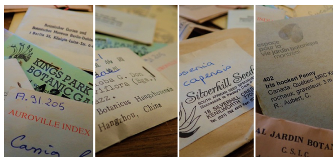
Sachets de graines de provenances diverses