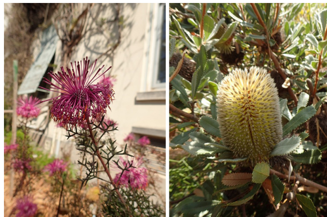
Isopogon formosus (à droite) / Banksia ornata (à gauche)

L'équipe de l'unité expérimentale Villa Thuret poursuit les travaux d'acclimatation initiés il y a un peu plus de 160 ans, dans un contexte scientifique, juridique et sociétal différent, notamment avec la nécessaire adaptation des espèces et des pratiques à l'évolution du climat et ses répercussions futures sur les filières horticoles, sylvicoles et paysagères méditerranéennes.