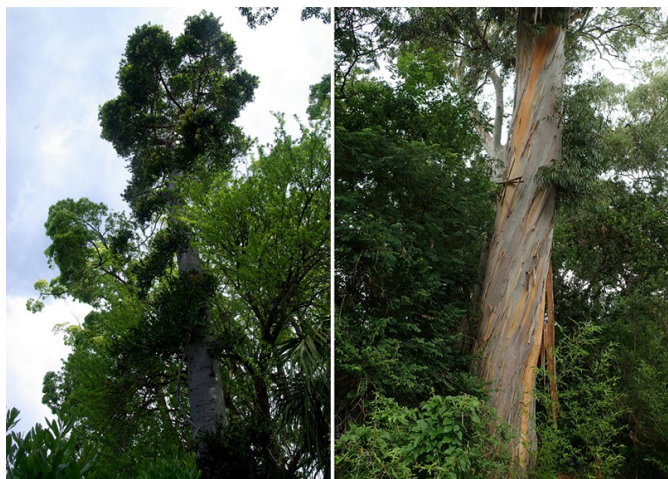
Agathis robusta (à gauche) et Eucalyptus viminalis (à droite)

Certaines plantes ne proviennent pas de régions à climat méditerranéen ( Agathis robusta , Afrocarpus manii ), mais ont montré une résistance aux aléas climatiques locaux (gel, sécheresse, vent...). Certaines comme Jacaranda mimosifolia ou Ti-puana tipu ont un feuillage persistant dans leur région d'origine, mais caduc ici, en raison du froid hivernal. Ces exemples illustrent la plasticité de certaines espèces, qui en fonction de leur provenance et de leur physiologie, ont plus ou moins de facilité à s'accommoder du climat Azuréen.