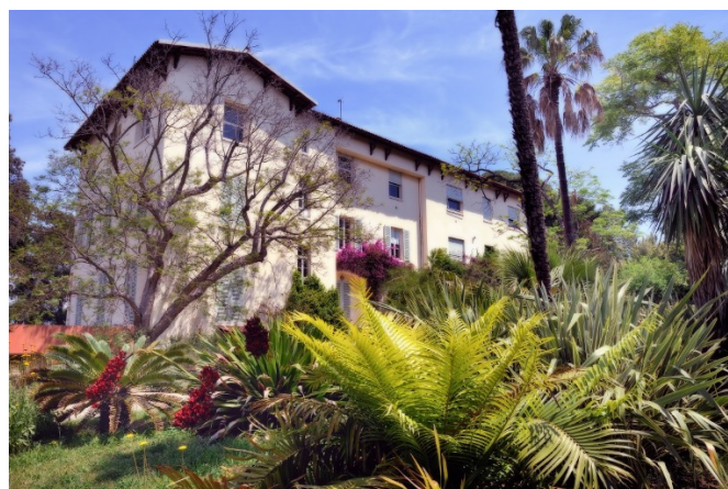
La villa Thuret aujourd'hui