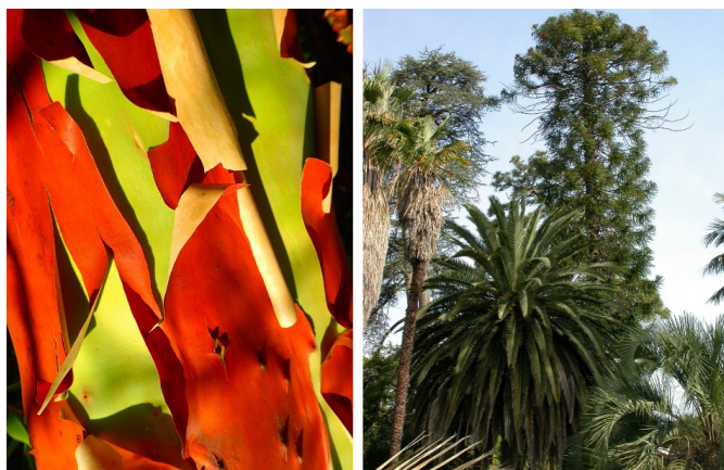
Écorce d' Arbutus glandulosa en fin de journée (à gauche) / Diversité d'espèces (à droite)

À l'étonnement des visiteurs qui souvent n'imaginent pas le travail en amont, pendant et après la mise en culture, nous répondons que ces précautions et protocoles nous permettent de recueillir un maximum de données et de limiter les risques environnementaux. Ces données nous permettent d'observer les mécanismes de croissance et d'adaptation des plantes au contexte, sur plusieurs années, d'identifier des arbres d'avenir et d'affiner les techniques de culture.