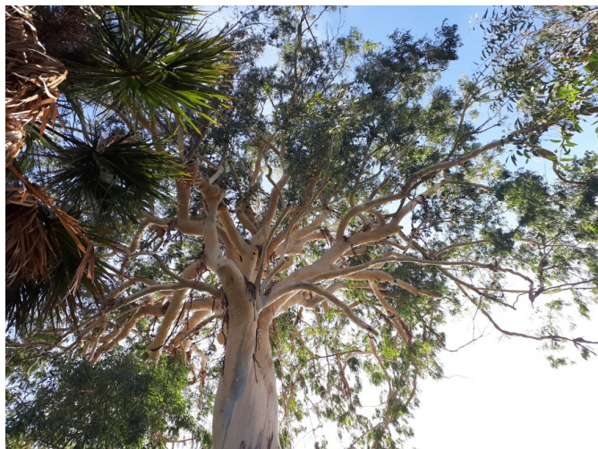
Eucalyptus dorricensis de plus de 150 ans