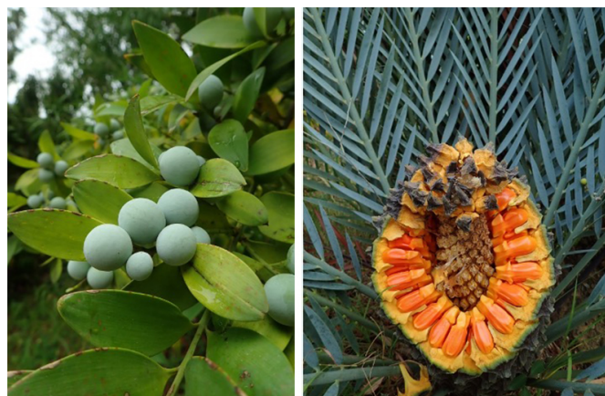
Fruits de Nageia nagi (à gauche) et Fruits d' Encephalartos lehmannii (à droite)