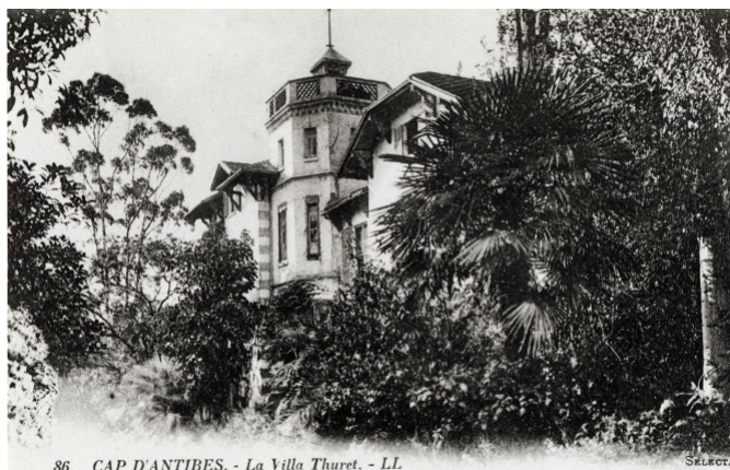
86 CAP D'ANTIBES. - La Villa Thuret.

À son arrivée, il fit arracher la plupart des plantes déjà en place pour y entreprendre des essais systématiques d'introduction et d'acclimatation de végétaux exotiques. Décision surprenante pour la population rurale du cap d'Antibes et des alentours, qui cultivait essentiellement des plantes vivrières telles que l'olivier, la vigne, le blé, les arbres fruitiers.