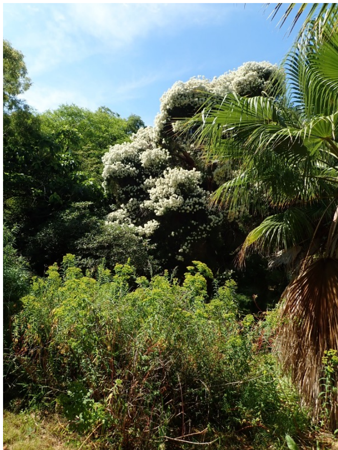
Vue du jardin