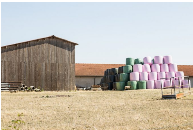
Ils nourrissent aussi le bétail avec du foin dès l'été, épuisant les réserves de fourrage pour l'hiver et les contraignant à en importer à des prix de plus en plus élevés...