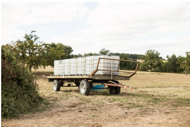
Les agriculteurs sont contraints de véhiculer des citernes d'eau dans les champs.