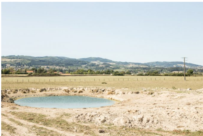
Les retenues collinaires censées recueillir l'eau pluviale s'assèchent aussi.