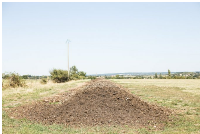
Le maïs, utilisé en ensilage pour nourrir les bovins, ne pousse pas sans un arrosage abondant. Sa culture est de plus en plus remise en question au profit d'autres plantes fourragères, plus économes en eau, comme le sorgho ou des graminées.