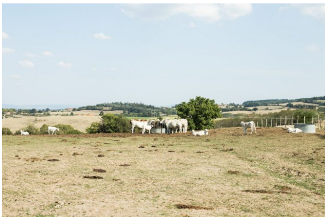
L'élevage intensif est remis en cause, il faut réduire le cheptel.