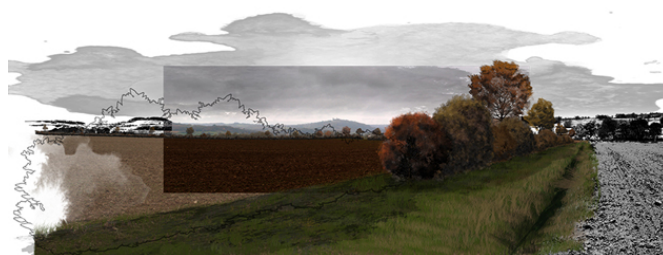
Face à la colline éternelle, un projet de paysage agroforestier.

Ce projet vise certes un intérêt privé lié au développement d'une activité économique, mais il améliore également la qualité de vie du territoire et la qualité à court, moyen et long terme du paysage Vézélien. En effet, il s'agit ici de dépasser la simple initiative privée et de percevoir ce projet comme une amorce à une transition agroécologique garante de la préservation des paysages vézéliens par une dynamisation et une pérennisation de l'agriculture locale.