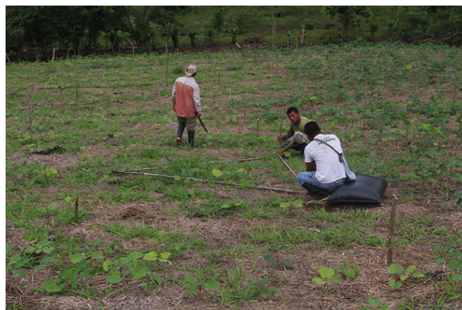
Mise en place de la trame agroforestière.

La stratégie végétale déployée fabrique un paysage stratifié, générateur d'une biodiversité perdue. Il ne s'agit pas de reconstituer des forêts. Il ne s'agit pas de renaturation ni de restauration, mais d'un projet de paysage en réponse au changement climatique, à l'adaptation de nos systèmes de production et de leurs environnements respectifs.