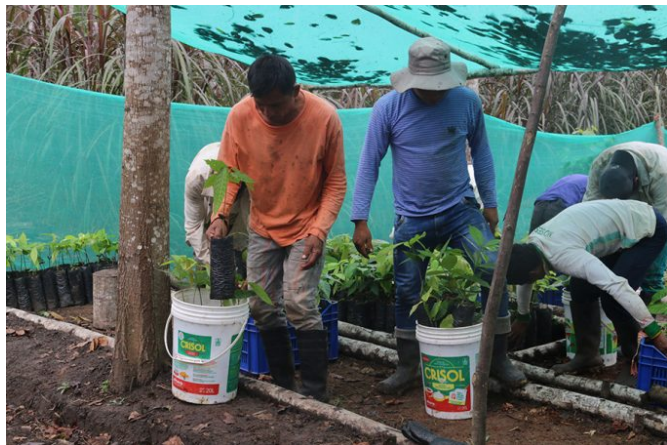
Préparation des plants de cacao issus de notre pépinière in situ

tographiques qui nous permettront avec les ingénieurs agronomes de dessiner les parcelles, mesurer le linéaire de haies et de mener les premiers inventaires faune et flore. Cette situation me poussera à fabriquer des documents simplifiés que nous partagerons avec l'ensemble des équipes lors de « capacitacion », des journées de formation habituellement organisées par l'ONG à raison d'une à deux formations par mois auprès du personnel.