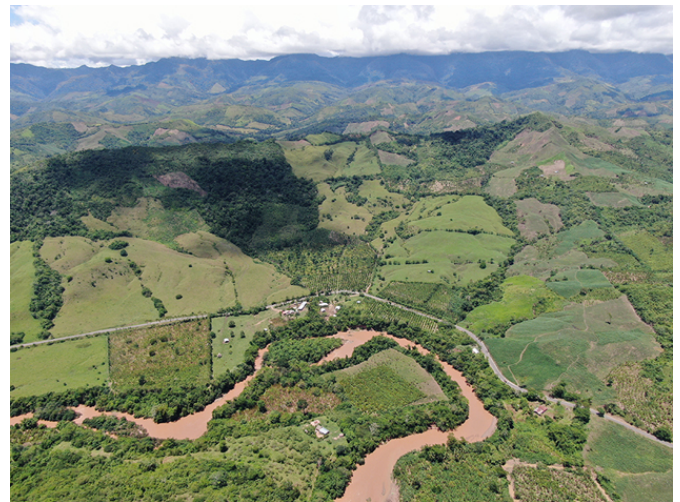
Déforestation et mitage agricole autour du Rio Sisa.