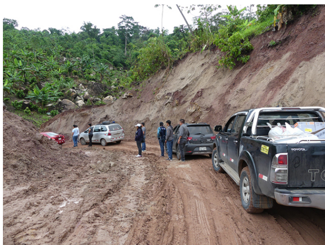
Sur la route menant au projet, la déforestation entraîne des éboulements fréquents