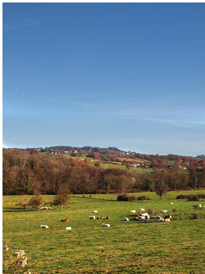
Rencontre avec les charolaises et les aubrac au sein des pâtures.