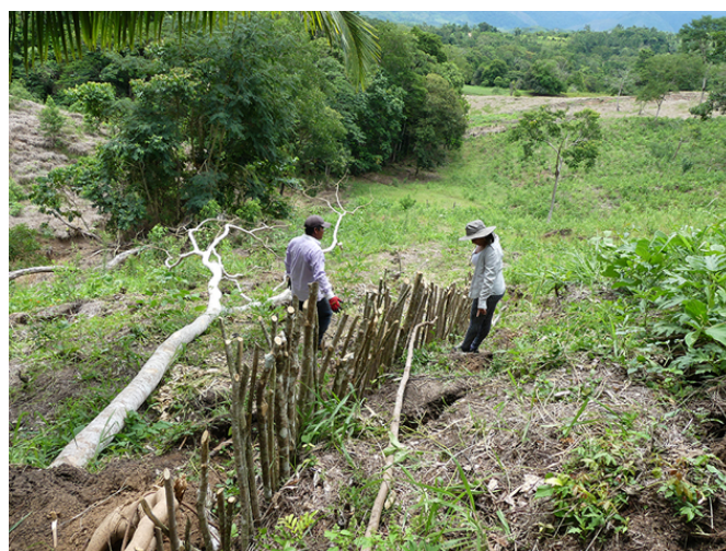
Implantation des « barreras vivas » pour lutter contre l'érosion

Il faudra du temps pour que ces projets agroforestiers s'expriment pleinement. Les temporalités liées à l'activité de la ferme, Vézélienne comme Péruvienne ne sont les mêmes que celles qui animent les projets d'aménagements urbains. Avant de résonner auprès d'autres agriculteurs et d'entamer