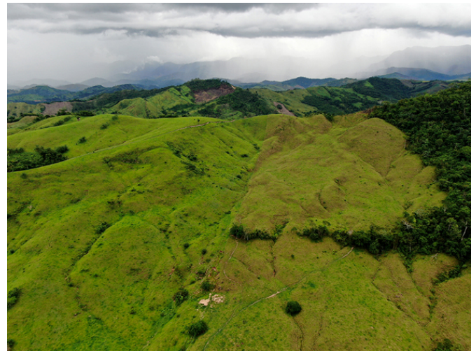
Les paysages déforestés de la région de San Martín.

Cette expérience apparaît comme une première confrontation avec la réalité de la déforestation. Cette complexité de contexte s'exprime aussi par les premières prises de contact avec les acteurs du territoire : exploitants, coopérative agricole, autorités locales, porteurs de projets ou membres de l'ONG. Ces rencontres font émerger la difficulté des objectifs d'intégration sociale, indissociable à la réussite d'un projet agroforestier ici, au Pérou. Les populations locales ont été ébranlées par des programmes agricoles ou de reforestation nationaux et provinciaux brutalement abandonnés, parfois jamais commencés ou qui révèlent fréquemment des cas de corruptions. Sensibiliser et diffuser au sujet d'un modèle agroforestier durable apparaît compliqué. En agroforesterie, l'engagement sur le long terme est primordial, mais les porteurs de projet souhaitent souvent une rentabilité économique à court ou moyen termes. Il me faudra plusieurs mois pour prendre la mesure du travail attendu face à un modèle d'agriculture intensive encore largement diffusé et incité par les coopératives agricoles locales.