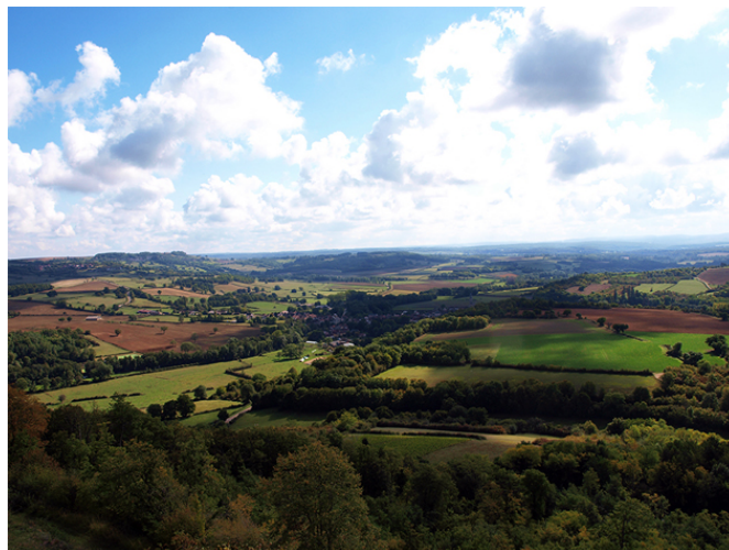
Vue sur la vallée de la Cure depuis la terrasse de Vézelay.