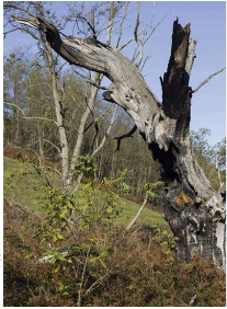
© 2011 Syndicat d'Initiative de Gersulles-Esches La montagne brulée est un paysage unique qui a été créé par le feu.

La montagne brulée est un paysage unique qui a été créé par le feu. Les travaux de réhabilitation des chemins de randonnée sont réalisés par le Syndicat d'Initiative de Gersulles-Esches, en collaboration avec le Service de l'Équipement Rural de la Région de Lorraine et par les volontaires du DDT de la région de Gersulles-Esches. Ces travaux de réhabilitation ont été financés par le Syndicat d'Initiative de Gersulles-Esches et par le Département de la Moselle.