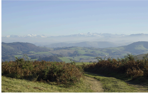
© 2011 Syndicat d'Initiative de Gersulles-Esches Les chemins de haute randonnée sont aménagés de manière écoresponsable par le Syndicat d'Initiative de Gersulles-Esches.

Les chemins de haute randonnée peuvent être aménagés de manière écoresponsable. Les travaux de réhabilitation des chemins de randonnée sont réalisés par le Syndicat d'Initiative de Gersulles-Esches, en collaboration avec le Service de l'Équipement Rural de la Région de Lorraine et par les volontaires du DDT de la région de Gersulles-Esches. Ces travaux de réhabilitation ont été financés par le Syndicat d'Initiative de Gersulles-Esches et par le Département de la Moselle.