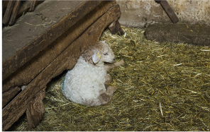
Les bêtes ont besoin d'un confort optimal pour être en bonne santé.

Les bêtes ont besoin d'un confort optimal pour être en bonne santé. Les travaux de réhabilitation des chemins de randonnée sont réalisés par le Syndicat d'Initiative de Gersulles-Esches, en collaboration avec le Service de l'Équipement Rural de la Région de Lorraine et par les volontaires du DDT de la région de Gersulles-Esches. Ces travaux de réhabilitation ont été financés par le Syndicat d'Initiative de Gersulles-Esches et par le Département de la Moselle.