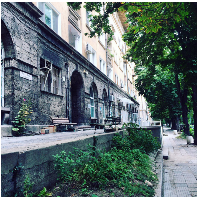
L'espace public et ses variations

Et là, un petit quelque chose « en plus » : ce « trottoir » s'organise sur 2 niveaux, quelques marches distinguent en effet un trottoir « bas » d'un trottoir « haut », voire un trottoir « public » d'un trottoir « privé » ?