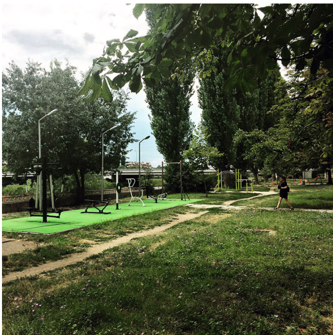
Équipements sportifs d'extérieur en bordure de Maritsa

certains ploient avec le temps, le calepinage en éventail des pavés, puis le trottoir opposé.