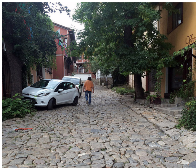
De la vanité des valises à roulettes

Ce décor de carte postale est superbe sauf qu'il n'est pas PMR, c'est-à-dire inadapté aux Personnes à Mobilité Réduite. Impossible de faire rouler ma valise sur cette mosaïque géante de roches qui constitue trottoirs et chaussée. Mais tout au long de mon voyage en Bulgarie, toujours une âme charitable il y aura pour m'aider.