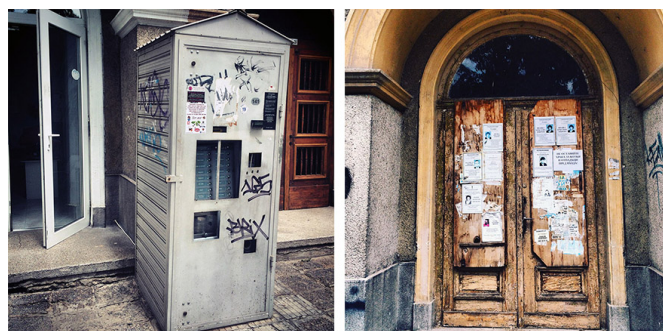
Machine à café d'extérieur / L'intime et le public

Le bâtiment autour duquel sont organisés ces espaces a quelque chose de particulier : si le matériau de sa façade n'est pas des plus élégants, son dessin est généreux et soigné : beaucoup de fenêtres, celles du rez-de-chaussée ont même la forme d'arcade. Certaines portes sont en bois délicatement travaillées. Et, surprise, je découvre, collées sur ces portes, une dizaine de feuilles format A4 : des photos de portraits plus ou moins belles, certaines en noir et blanc, d'autres verdâtres. Je vois des mots que je devine être des noms et prénoms, des séries de chiffres : dates de naissance et dates de décès. Bizarre de se voir confrontée sans prévenir aux « départs » de personnes inconnues. J'ai l'impression de m'être immiscée dans l'intimité de la vie du quartier et je me sens un peu mal à l'aise.