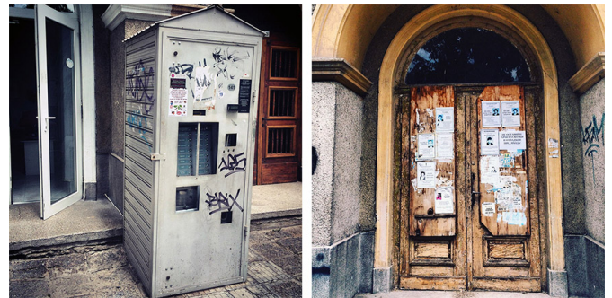
Machine à café d'extérieur / L'intime et le public

Le bâtiment autour duquel sont organisés ces espaces a quelque chose de particulier : si le matériau de sa façade n'est pas des plus élégants, son dessin est généreux et soigné : beaucoup de fenêtres, celles du rez-de-chaussée ont même la forme d'arcade. Certaines portes sont en bois délicatement travaillées. Et, surprise, je découvre, collées sur ces portes, une dizaine de feuilles format A4 : des photos de portraits plus ou moins belles, certaines en noir et blanc, d'autres verdâtres. Je vois des mots que je devine être des noms et prénoms, des séries de chiffres : dates de naissance et dates de décès. Bizarre de se voir confrontée sans prévenir aux « départs » de personnes inconnues. J'ai l'impression de m'être immiscée dans l'intimité de la vie du quartier et je me sens un peu mal à l'aise.