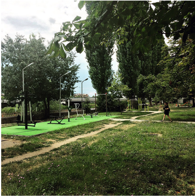
Équipements sportifs d'extérieur en bordure de Maritsa

certains ploient avec le temps, le calepinage en éventail des pavés, puis le trottoir opposé.