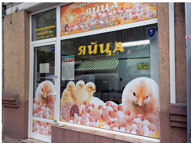
Un clin d'œil capitalistico-kitsch

Je finis par trouver refuge sous la tonnelle en bois d'un restaurant qui se présente comme « traditionnel ».