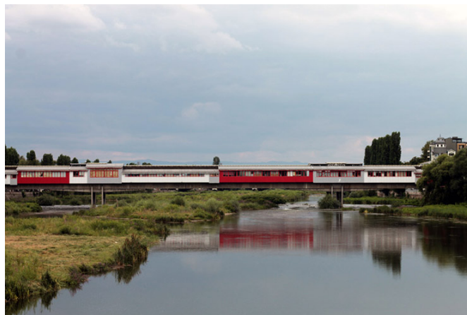
Le « Ponte Vecchio » de Plovdiv

J'aperçois ensuite un curieux « Ponte Vecchio », constitué de préfabriqués (avec fenêtres) de couleurs rouge, grise et blanche. Il s'agit de « Ul. Brezovska », une passerelle piétonne autour de laquelle s'organisent les boutiques d'une galerie commerciale, comme je le découvrirai un peu plus tard.