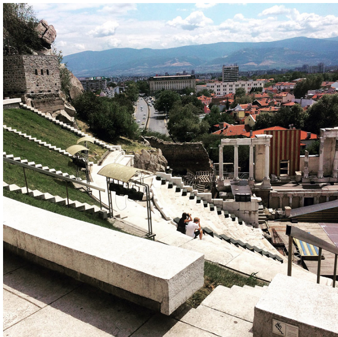
Le théâtre antique de Plovdiv

Un peu plus loin, autre contraste de genres : dans la zone piétonne commerçante, l'ancien stade romain jouxte la mosquée Djoumaya, qui elle date du XVe siècle. Si l'ancien stade me laisse indifférente – je trouve décidément difficile d'intégrer de manière vivante des vestiges de l'époque romaine dans la vie contemporaine (peut-être une histoire de matériaux et le caractère « ouvert » de ces équipements), je suis touchée par la délicatesse de l'architecture de la mosquée Djoumaya. Trace de la période ottomane de Plovdiv, les motifs simples et élégants du fin minaret, le dessin des agencements de briques et de pierres de la façade, la terrasse attenante... je tombe sous le charme.