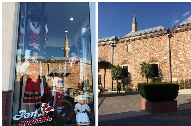
Plovdiv, ville palimpseste / La mosquée Djoumaya

Un peu plus loin, autre contraste de genres : dans la zone piétonne commerçante, l'ancien stade romain jouxte la mosquée Djoumaya, qui elle date du XVe siècle. Si l'ancien stade me laisse indifférente – je trouve décidément difficile d'intégrer de manière vivante des vestiges de l'époque romaine dans la vie contemporaine (peut-être une histoire de matériaux et le caractère « ouvert » de ces équipements), je suis touchée par la délicatesse de l'architecture de la mosquée Djoumaya. Trace de la période ottomane de Plovdiv, les motifs simples et élégants du fin minaret, le dessin des agencements de briques et de pierres de la façade, la terrasse attenante... je tombe sous le charme.