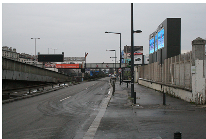
L'ancienne Estrée, avenue du Président Wilson, mars 2018

marcheur se sent soudainement fragile et vulnérable. Suivre ensuite pendant trop longtemps la trajectoire ennuyeuse et rectiligne de la longue dalle qui recouvre l'Autoroute A1, passer en bordure de la zone de la Montjoie puis en contrebas du stade de France, voir avec une certaine joie l'eau du canal, arriver sur le flanc de la Basilique par la rue de la Légion d'Honneur. Cette dernière portion du voyage correspondait historiquement, selon Anne Lombard-Jourdan à celle de la translation des reliques. Les moines de Saint-Denis, soucieux d'asseoir leur pouvoir, avaient fait rapatrier les restes du martyr. Il avait suffi ensuite de raconter une invraisemblable histoire, celle d'un homme, plus grand que les hommes, capable de marcher, bien que sans tête, plusieurs kilomètres avant de s'effondrer.