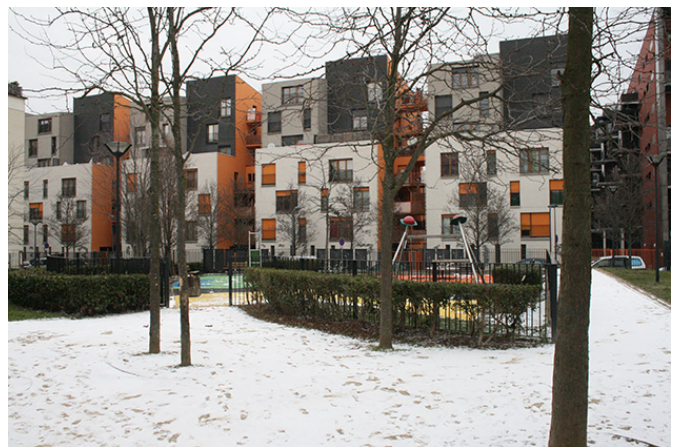
Le square de la Montjoie, mars 2018

Restait aujourd'hui la petite rue de la Montjoie qui traversait, hésitante ce quartier sans grandeur et sans noblesse particulière. Un petit square pour enfant, minuscule renflement du paysage tapissé de sol synthétique, surmonté par les structures, les toboggans, les passerelles. Une fine couche de neige tombée quelques heures auparavant achevait de rendre un peu triste cet endroit en ce jour glacial et venté. Des immeubles à la façade en partie orange ne parvenaient pas à l'égayé.