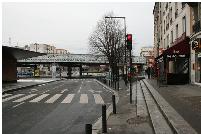
L'ancienne Estrée, avenue du Président Wilson, à l'approche du carrefour avec la rue du Landy et les voies du RER B, mars 2018

de voie pavé par les Romains sur l'immense route de l'étain qui partait de Rome jusqu'en Angleterre, et dont le Lendit était le grand carrefour, en plaine. Ce fut longtemps la seule route qui relia Paris à Saint-Denis. C'était devenu, encore des siècles plus tard, la Nationale 1 puis une autoroute. Reprenant mentalement le cours de la rue du Landy, je me souvins qu'il s'agissait du second passage, la rue à nouveau s'infléchissait légèrement pour passer sous les voies du RER B. Je me souvenais du vacarme sans nom de cet endroit quand je m'en approchais. Ce que je ne savais pas, c'est qu'au-dessous passait l'autoroute A1. Ce carrefour en étoile sur trois étages, où je devais me débrouiller à vélo pour me frayer un passage c'était le croisement de la rue du Landy avec l'Estrée.