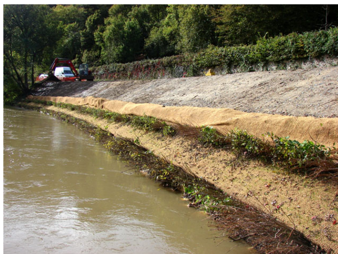
en bois vivant

En assainissement avec objectif 'zéro rejet' en complément après une épuration par des plantes héliophytes, C'est un bois de feu et un bois d'œuvre médiocre, mais il est utilisé en 'taillis à très courte rotation' sous les climats du nord de l'Europe pour fournir, grâce à une forte production de biomasse, les chaudières des centrales électriques.