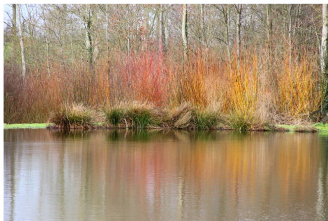
exemple de couleurs de jeunes rameaux en hiver

Ils sont souvent verdâtres, mais aussi jaunes, rouges, oranges, bicolores... Ils peuvent être très pubescents (Salix lanata par exemple).