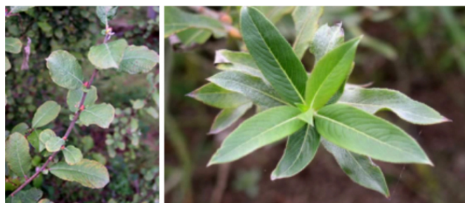
Salix aurita et Salix gracilistyla

Elles sont toujours entières, mais d'épaisseur, de rugosité et de pilosité variées. Quasi toujours à apex pointu. Longueur de 1 à 20 cm et largeur de 5 mm à 10 cm. Il faut aussi signaler, parfois la présence de stipules (dites oreillettes) plus ou moins pérennes.