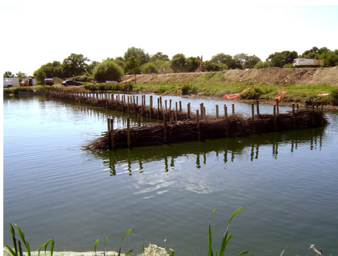
stabilisation de berge en bois mort

En génie végétal pour le maintien des berges : en bois morts comme ci-dessous ou en bois vivant pour stabiliser des berges sur le long terme,