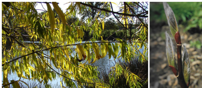
Salix daphnoides : feuillage de fin d'été et éclosion des bourgeons à une seule écaille