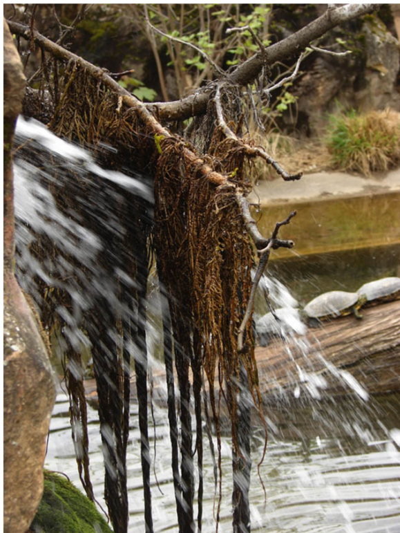
racines de saule poussant dans l'air humide d'une cascade dans le jardin botanique de LYON

Tous les saules produisent des millions de graines emportées, potentiellement très loin, par le vent et l'eau et même accrochées aux pelages ou aux plumes des animaux, Les rameaux (jeunes ou très vieux) de la majorité des espèces se bouturent, à l'endroit comme à l'envers, de même que les racines grâce à la présence d'amas de cellules indifférenciés partout. Néanmoins le bouturage est peu facile pour, par exemple, Salix caprea , Salix hakuro , Certaines espèces drageonnent ( Salix interior ), Certaines ont des rameaux très cassants ( Salix fragilis ) ou très souples et longs (divers saules pleureurs) pour conquérir l'espace lors d'épisodes de vents ou d'inondations.