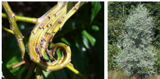
Salix sachalinensis 'sekka' et salix alba 'sericea'

Les chatons mâles peuvent être très voyants : rouges ( Salix purpurea ), noirs ( Salix melanostachys ), jaunes (les plus nombreux), mais aussi odorants et mellifères. Et ceci dès janvier selon la météo et les espèces. Ainsi la floraison des saules fait du bien au moral des humains et à l'appétit des insectes téméraires.