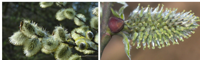
chatons mâles / chaton femelle

Les chatons femelles sont plus discrets et deviennent les fruits.