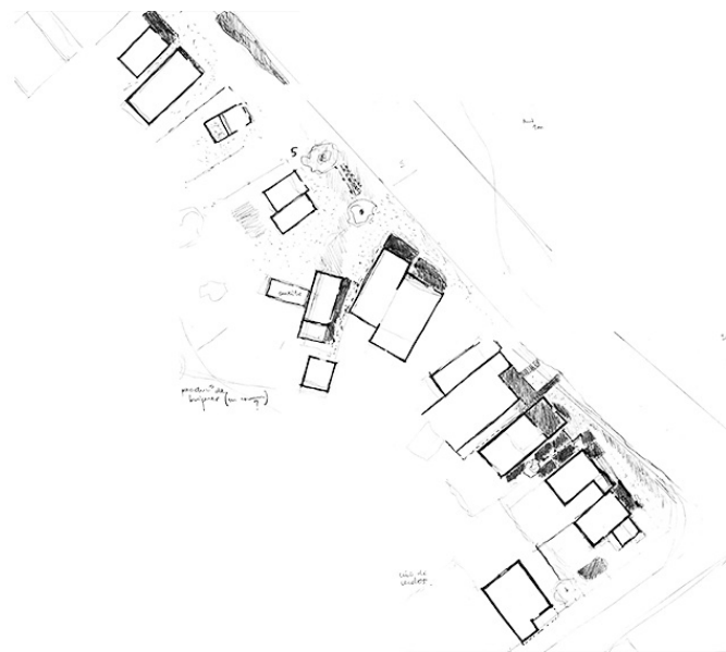
Re-dessin à la main d'un échantillon des habitats. © Randier Etienne

Cet habitat n'a jamais été représenté. Pourtant, la diversité de ses espaces et l'intensité d'usages nous poussent à inventer des outils de représentation pour mieux le comprendre. Pour saisir le contexte d'émergence, nous effectuons différentes cartes de lectures à l'échelle du territoire Sacra parkway : projet passé de parc et parkway, risque de l'eau, activités économiques... En parallèle, nous re-dessignons à main levée différents échantillons d'habitats. Ces dessins nous révèlent certaines logiques d'organisation spatiale avec des espaces identiques qui se répètent tout en se configurant à chaque fois différemment. Différents outils de lectures sont alors produits.