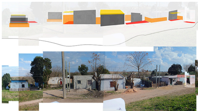
Outil des limites appliqué : sélection et classement.

Ces limites définissent en creux des espaces ouverts et emboîtés. Ils sont des espaces de « co-présences » et de négociation, entre les deux (10). C'est la représentation de ces espaces, sans montrer l'espace de l'habitat lui-même, qui nous permet de changer de regard, et de montrer les qualités de cet habitat.