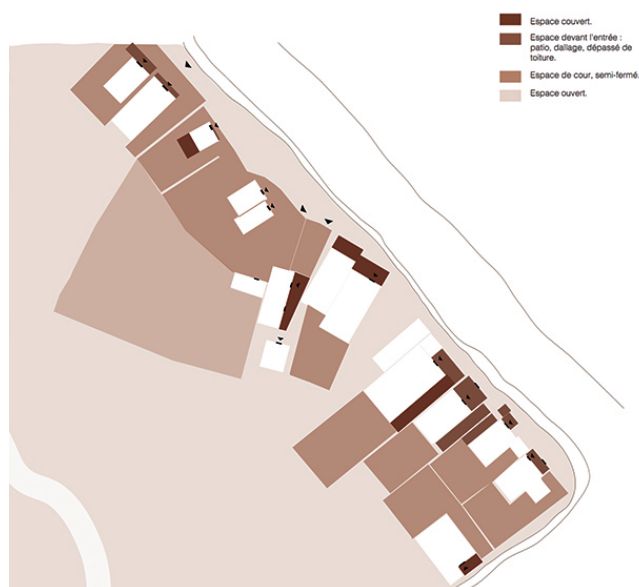
Outil des « espaces ouverts » appliqué.

Ces limites définissent en creux des espaces ouverts et emboîtés. Ils sont des espaces de « co-présences » et de négociation, entre les deux (10). C'est la représentation de ces espaces, sans montrer l'espace de l'habitat lui-même, qui nous permet de changer de regard, et de montrer les qualités de cet habitat.