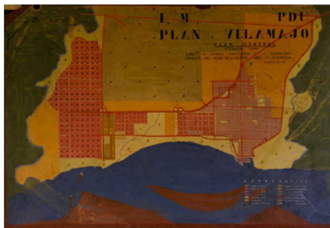
Plan Vilamajo.