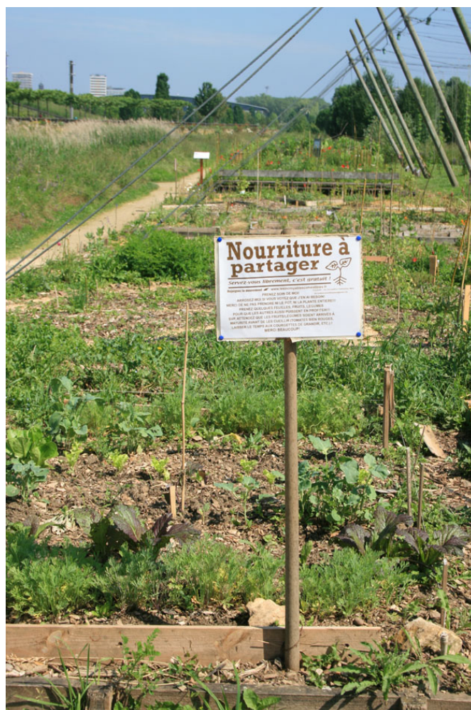
Une parcelle dont la production est « à partager », au sein des Jardins J-M Pelt – Parc de la Seille (Metz)

Certes, les projets d'agriculture urbaine ou plus modestement de jardins partagés en ville sont anecdotiques au regard des enjeux alimentaires. Pour une fraction des participants, ils peuvent cependant offrir de rares conditions d'accès à une alimentation plus riche, saine et variée. Pour une plus large part, ils ont aussi une vertu pédagogique : mieux connaître les cycles saisonniers et les produits, s'initier à une agriculture raisonnée. Ces projets se traduisent par un renouvellement des codes esthétiques et répondent à l'aspiration d'une partie des citoyens.