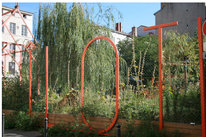
Le jardin d'Amaranthes, Lyon, un jardin collectif et militant

Coloco [12]. Plus classiquement, des projets de paysagistes-concepteurs offrent des marges de manœuvre, des libertés d'appropriation aux habitants, aux riverains [13], et permettent à ceux-ci de s'approprier l'espace public, de le faire évoluer à leur manière et ainsi de faire œuvre collective, en plantant, jardinant ou en équipant les lieux.