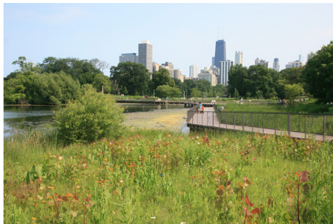
Renaturation du Lincoln Park de Chicago au départ imaginé par Olmsted.

Il n'empêche que l'évolution des questions écologiques semble bien avoir de l'influence sur les pratiques paysagistes et y construit ses propres codes esthétiques. Certains projets composent tout autant avec une nature aménagée, des plantations qu'avec une nature spontanée, des processus d'enfrichement, de recolonisation, etc. Dans le détail, les structures végétales semblent plus riches et diversifiées en essences : les plantations sont alors plus complexes (une traduction de la « biodiversité » au travers de structures végétales plus variées ?) et jouent avec des essences ordinaires ou endémiques. Les formes végétales se font plus denses, foisonnantes, luxuriantes et jouent tout autant un rôle de structures qu'un effet de textures caractérisant fortement les lieux. « Rypisylves », « lisières », « prairies », « mégaphorbiaie », la référence à des « milieux naturels » est également largement convoquée dans plusieurs projets contemporains, y compris pour être réinterprétée et recomposée autour d'un spectre nouveau d'essences ou de nouveaux écotopes. Bien sûr, cette observation appelle une enquête plus rigoureuse. Et, la posture des paysagistes par rapport aux sensibilités écologiques et à ses évolutions, resterait à approfondir.