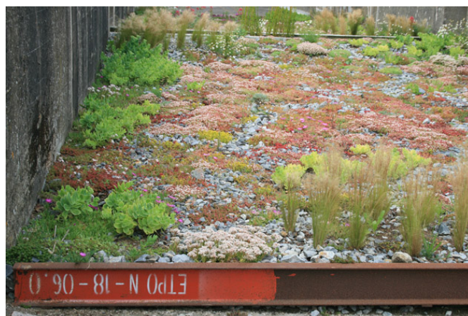
Le toit de la base sous-marine de Saint-Nazaire et le « Jardin du tiers paysage » imaginé par Gilles Clément.