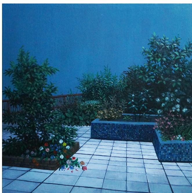
urbanités -12, huile sur bois, 30 x 30 cm, 2016

Si ITINERE est bien un voyage, c'est d'abord celui du peintre. Mais si ses yeux le portent vers des espaces contraints par des murs droits rigides, les ponts serpentins et les routes galbées peuvent alors dans leur rondeur même rivaliser avec la végétation : rivalité fraternelle ou fratricide ? Dans une lettre de Cicéron à son ami Atticus ne trouve-t-on pas « De meo itinere variae sentantiae ». Que l'on peut traduire par « les opinions sont fort partagées sur mon voyage ». Si ITINERE est bien un voyage, c'est aussi celui du « spectateur » qui jugera lui-même de la couleur de la rivalité : « variae sententiae », mais quelle que soit l'issue c'est l'harmonie de l'ensemble qui prévaudra. Le matériel et l'immatériel mêlés, opposés ou explosés dans une partition cohérente et soignée voilà bien ce que nous offre ITINERE.