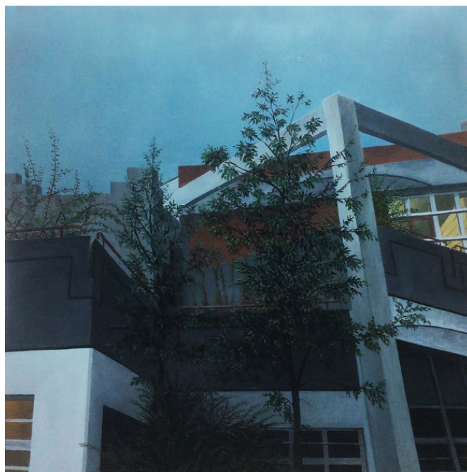
urbanités -10, huile sur bois, 30 x 30 cm, 2016