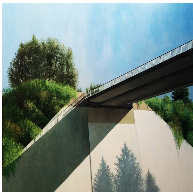
Départ en Vacances – 02, huile sur toile, 150 x 150 cm, 2015