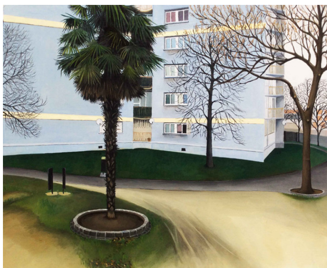
les lignes silencieuses – 02, huile sur papier, 45 x 55 cm, 2015

hors de la « cité » en des lieux de passage qui ne comptent de la vie que des accidents de pylône et quelques traces de fantômes, si l'on n'y prend garde. Mais il y a surtout et d'abord cette végétation vibrante : c'est feuille par feuille que Dorian lui donne l'humanité joyeuse de ses poses indociles. Il reprend alors les recettes de l'école du paysage de la Renaissance italienne et parvient ainsi à transfigurer ces multiples « passages » les poussant même vers une forme de fantasmagorie ! Les jeux d'ombres et de lumières, l'unicité de chaque feuille, la composition particulière tournée vers des cieux plus clairs n'évoquent-ils pas alors, un ou des « paradis » à venir ?