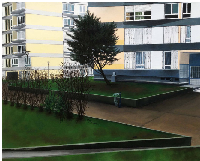
les lignes silencieuses – 04, huile sur papier, 45 x 55 cm, 2015

Mais ils appartiennent tous à une «collection» ou comment se séparer pour un temps, avant que de se retrouver. Les lignes silencieuses – s'écoutent sans rien dire, un duel s'engage entre bâtiment érigé, pointu, carré et le végétal vibrant, fragile mais libre. Si l'homme a bel et bien « planté » les deux «éléments», sait-il combien l'arbre, l'herbe, les buissons pourront se jouer de lui, au gré des saisons ?