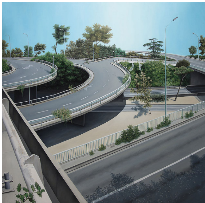
Départ en Vacances – 05, huile sur toile, 200 x 200 cm, 2015