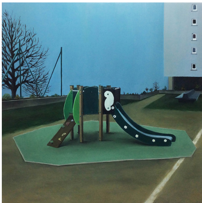
urbanités-04, huile sur bois, 30 x 30 cm, 2016

Les urbanités – une série d’huiles sur bois, voilà bien le matériau rêvé qui donne sa place et sa valeur aux grands arbres des campagnes... Non, Dorian ne quitte pas la ville : il nommera ces pièces « nature morte urbaine ». La ville est ici peinte de nuit, et le matériau est « vernis » par de multiples couches de glassis, un peu comme une miniature du Moyen-Âge. Difficile de ne pas noter la poésie de l’ensemble : un arbre droit comme un «i» fanfaronnant sur un balcon, des toboggans pour petits corps ou un arbre chaussé d’une immense sandale de mosaïque. Un inventaire à la Prévert.