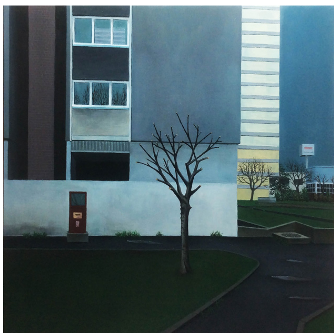
urbanités -09, huile sur bois, 30 x 30 cm, 2016