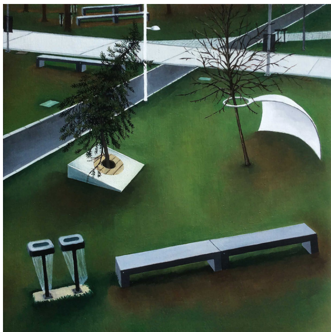
urbanités -01, huile sur bois, 30 x 30 cm, 2015