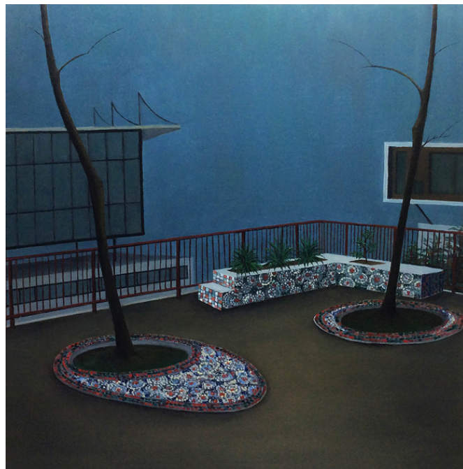
urbanités -05, huile sur bois, 30 x 30 cm, 2016