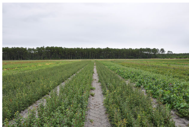
Pépinières Naudet Préchac

C'est donc dans un contexte de prise de conscience générale de l'importance de l'origine « génétique » des végétaux pour la conservation de la biodiversité que se développe le label Végétal local. Ce label permet de valoriser le travail de producteurs qui effectuent déjà des récoltes en milieu naturel de graines de base pour leur production. Mais l'émergence de ce label va plus loin, en créant de nouveaux métiers jusqu'à alors très « confidentiels » (récolteurs de graines de ligneux sauvages ou d'herbacées, naisseur...) et de nouvelles filières dans les territoires, avec l'appui d'un réseau de correspondants locaux au label.