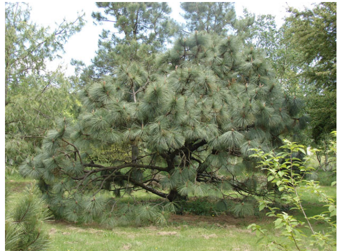
Pinus rudis Endl.