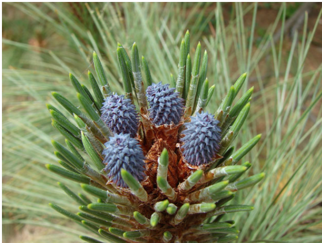
Cônelets de Pinus rudis Endl

Sur le plan olfactif, car il y en a un, qui n'a pas été charmé par la douce odeur de la litière du pin, notamment lors des chaleurs d'été ou par le moelleux si particulier aux pieds lorsque l'on se promène sur ce matelas d'aiguilles sous l'ombfrage léger de ces arbres. Quand on a vécu son enfance au bord de la mer, comme c'est le cas d'Alain, on associe aux pinèdes, la joyeuse ambiance des vacances d'été. Et depuis, que d'images encore d'arbres magnifiques, l'une des plus récentes étant celle d'un très gros pin parasol sur l'île de Porquerolles.