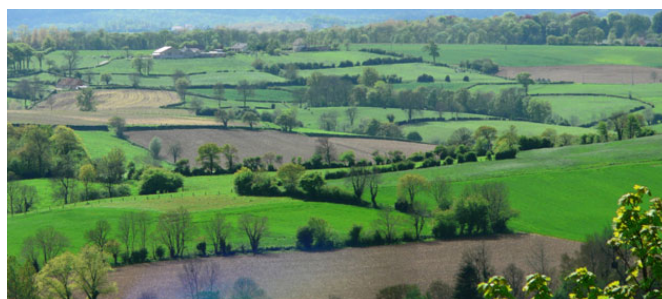
Figure 1 – Structure et dynamique du paysage. Ce paysage se caractérise par sa composition (surface totale en cultures, surface bâtie, surface boisée, linéaire de haie) et sa configuration (par exemple les haies ne sont pas toutes connectées entre elles, les parcelles cultivées ont des tailles et des formes différentes). Les composantes de ce paysage ont des dynamiques différentes, avec des changements rapides dans les cultures par rapport aux éléments plus pérennes comme les bois et les haies. Tous ces éléments paysagers vont influencer la présence, les déplacements et la pérennité des populations d'espèces végétales et animales en fonction de leurs caractéristiques biologiques et écologiques. Photo : «Bocage boulonnais» par Matthieu Debailleul – http://aascalys.free.fr . Sous licence CC BY-SA 3.0 via Wikimedia Commons

semi-naturels telles les lisières forestières ou les strates basses des haies.