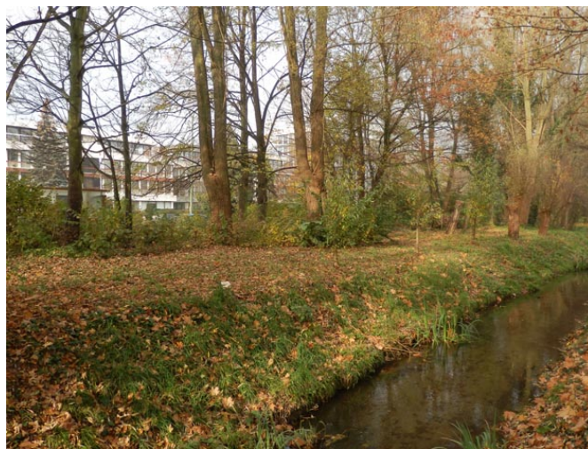
Exemple de promenade plantée et gérée écologiquement à Bruxelles

L'apparition d'une biodiversité urbaine est intimement liée à la dynamique de la ville. En effet tout a changé en un peu plus d'un siècle : les jardins publics présentent progressivement plus d'espaces naturels, maintenant gérés avec peu de pesticide ; les citadins appellent aujourd'hui de leurs vœux une nature de proximité et souhaitent arbres et animaux dans leur environnement quotidien ; certains animaux sauvages s'adaptent à ce milieu contraignant ; etc. Les recherches internationales soulignent que malgré une homogénéisation des faunes et des flores (mêmes espèces dans toutes les villes), des gestions plus écologiques des espaces entraînent l'installation de nombreuses espèces depuis les habitats naturels proches de la ville. Une nature locale peut donc s'installer en ville.