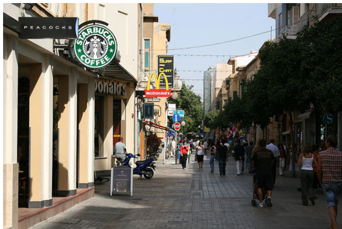
A quelques mètres de la rue Ermou, le centre-ville animé côté grec