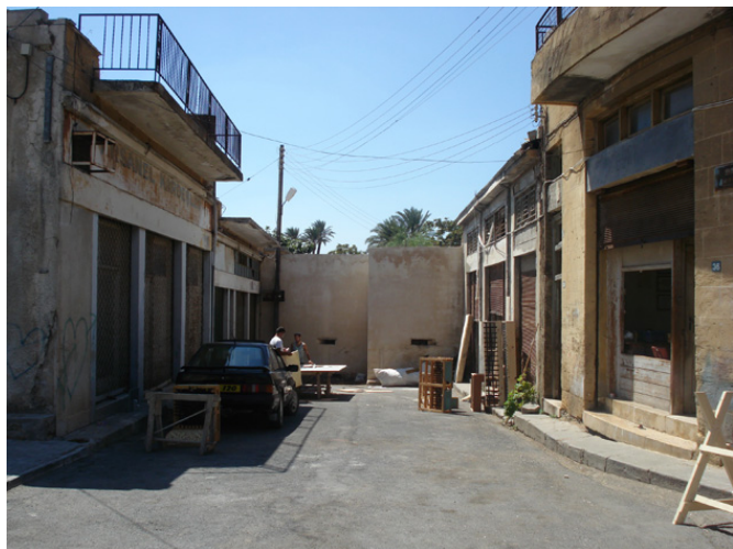
Les limites de la ZT dans le centre ancien occupé.