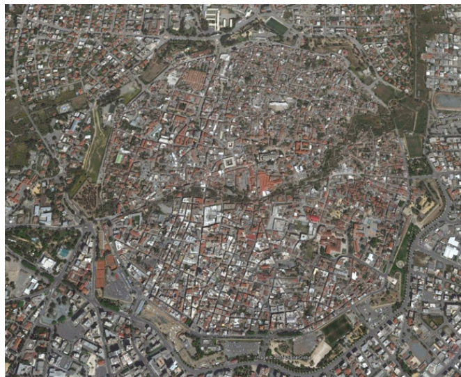
Photographie aérienne du centre ancien

Ici, on peut vraiment parler de no man's land , car personne ne peut y accéder, sauf les soldats de l'ONU qui y patrouillent.