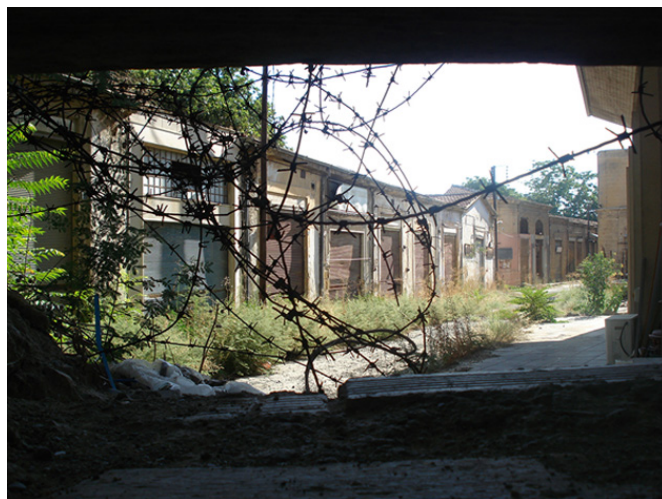
Photographie de la rue Ermou