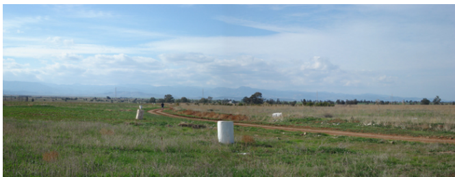
Limite entre zone cultivée et friche dans la zone tampon