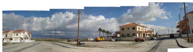
Limites entre ZT et urbanisation dans les quartiers pavillonnaires de Nicosie