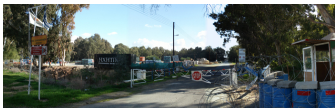
Point de passage en périphérie de Nicosie

Par endroits, il englobe également des entités particulières, des enclaves, comme l'ancien aéroport de Nicosie, abandonné depuis la guerre, et où l'ONU (3) a établi ses quartiers, ou le village de Pyla, placé sous l'administration de l'ONU, dans lequel vivent encore ensemble des Chypriotes grecs et turcs. Il est resté totalement interdit d'accès et même infranchissable jusqu'en 2004, date à partir de laquelle plusieurs points de passage ont été ouverts, qui permettent de se rendre d'une partie à l'autre de l'île, après délivrance d'un visa de courte durée.