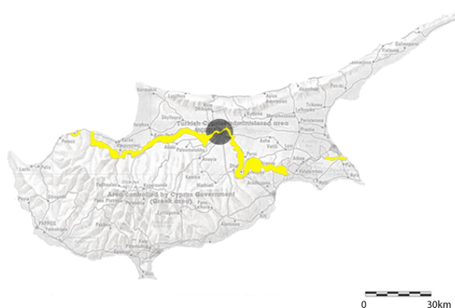
La zone tampon à l'échelle de l'île

Cette zone démilitarisée est alors confiée à l'UNFICYP (2), force des Nations Unies chargée du maintien de la paix à Chypre, dont la mission consiste notamment en une surveillance permettant une mise à distance effective entre belligérants.