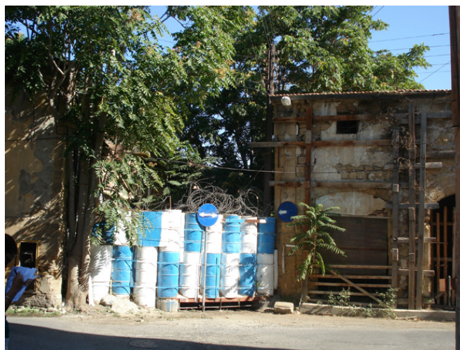
Zone tampon dans le centre-ancien : des espaces hors du temps