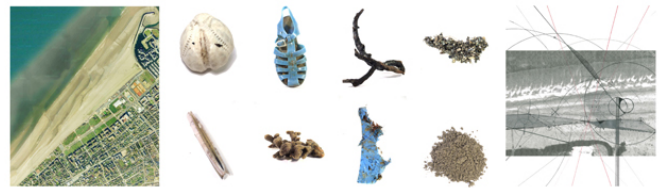
Mémoire. Petit P / récits de trouvailles, plage de Deauville

Lors de mon mémoire de troisième année, j'ai développé un protocole de recherche plastique à partir d'une série de parcours aléatoires sur 5 plages. Il s'agissait d'aller sur le site, de récolter 8 objets déposés par la mer, de les photographier sur fond blanc et d'écrire des textes à partir des photos. Puis, de «refaire» en mémoire le parcours au travers de la fabrication de cartes où les objets ramassés n'étaient que des points de repères du chemin parcouru. Les allers-retours entre site et objet, espace et récit, mémoire et parcours tendaient à la construction d'espaces imaginaires, hors du site de départ. Cette expérience de prélèvement d'un site par des objets et de regard sur l'expérience du corps dans celui-ci est un travail que j'ai voulu poursuivre pendant mon diplôme mais de façon à l'ancrer, l'inscrire et m'engager dans le réel du vécu, dans une perspective altruiste, à l'inverse de l'abstraction progressive solitaire que j'avais pu mener.