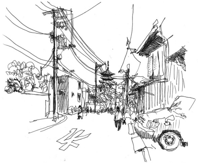
vers Kiyomizudera, kyoto mars 2012