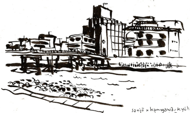
sanjō x kamegawa, kyoto 17 décembre 2011

https://www.revue-openfield.net/2014/01/30/kyoto/