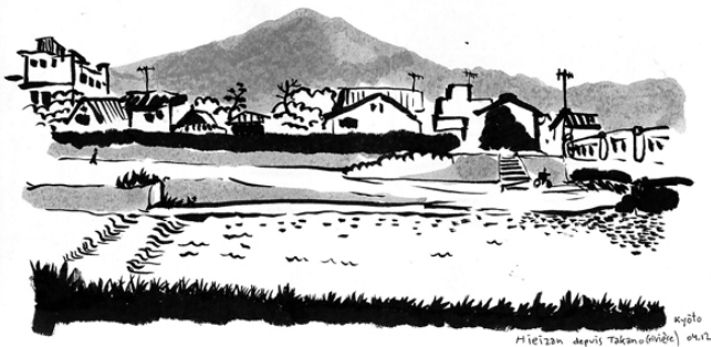
kyoto Mieizan depuis Takinuwabuchi 2012