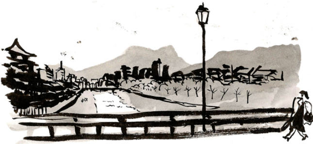
Kamegawa river, kyoto nov 11