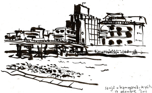
sanjo x kamegawa, kyoto 17 décembre 2011

https://www.revue-openfield.net/2014/01/30/kyoto/