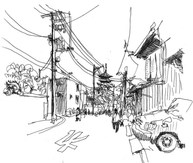
vers Kiyomizudera, kyoto mars 2012