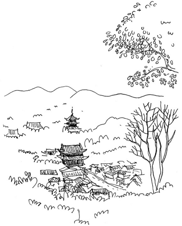
Ninns-ji, kyoto 17.09.12