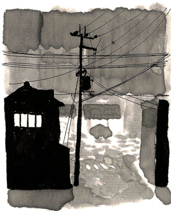
par la fenêtre, Kyoto 14 fev 2012