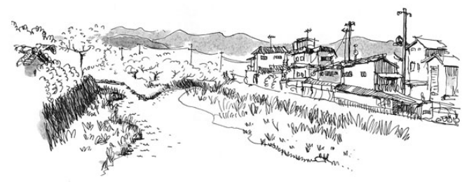
rivière Takano, non loin de Takaragidde - Kyoto, 14 avril 12