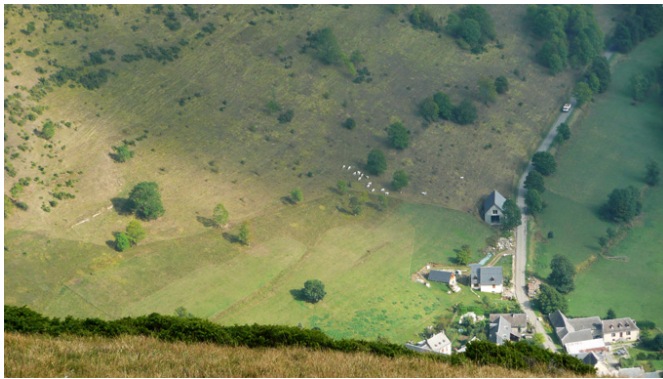
En vallée d'Oueil (31), l'attention des éleveurs portée aux prés, marque le paysage pastoral autour des villages

Ce questionnement aura alimenté la réalisation d'une thèse de géographie-aménagement (Henry 2012), dont cette présente réflexion est en partie tirée. Cette recherche doctorale paysagiste s'est intéressée à l'évolution des paysages pastoraux pyrénéens – leur « fermeture », ou non – en questionnant le rôle qu'ont pu jouer les transformations paysagères et leurs perceptions sensibles dans les formes d'action, les décisions ou les pratiques des acteurs locaux. Je me suis plus spécifiquement rapproché des éleveurs et de leurs pratiques d'élevage dans le contexte social et territorial de ces trente dernières années.