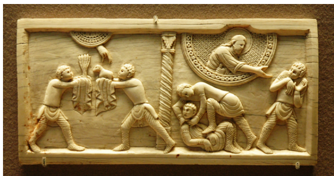
Cain et Abel / Ivoire / Louvre (Paris)

Dans un paysage champêtre, Caïn le paysan tue son frère Abel le berger. Son sang se répand dans les sillons du champ qu'il venait de labourer et Dieu maudit les récoltes des champs. Caïn est condamné à une errance sans fin sur la terre. Il fonde alors la ville d'Hénoch, du nom de son fils qui sera le premier d'une longue lignée de bergers faute de ne pouvoir cultiver la terre.