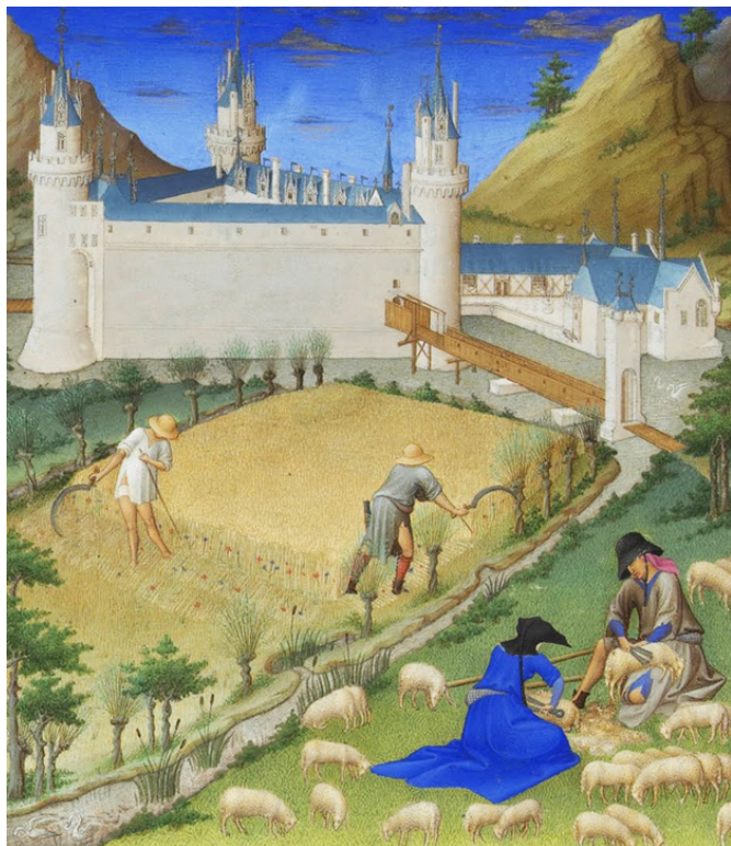
Les très riches heures du Duc de Berry / mois de Juillet

Les rapports entre villes et campagnes connaissent leurs plus gros bouleversements à la sortie de la seconde guerre.. La mécanisation a révolutionné les pratiques agricoles tout en soulageant l'homme de la pénibilité du travail. La chimie a permis des rendements supérieurs et des récoltes « propres » protégées des pestes. Instaurée depuis les années 1960, la politique agricole commune contribue à la séparation des raisons mêmes pour lesquelles les villes ont pris place géographiquement sur le territoire. Le rapport de la ville à son hinterland change d'échelle avec de surcroît la commercialisation des productions agricoles et son exportation à l'international. Le remembrement nécessaire à la mise en place de ce système a inévitablement eu un impact sur la manière dont l'urbanisation a investi les paysages ruraux en Europe. Dans les années 1960, les villes s'étendent essentiellement pour des raisons de production de logements... le constat est que de nombreux ensembles urbains ont perdu dès lors les limites de leur écrin logistique. L'urbanisation galopante que nous connaissons toujours depuis aurait-elle eu la même forme si l'échiquier parcellaire qui lui était offert avait eu une échelle bocagère ? La question vaut la peine d'être posée.